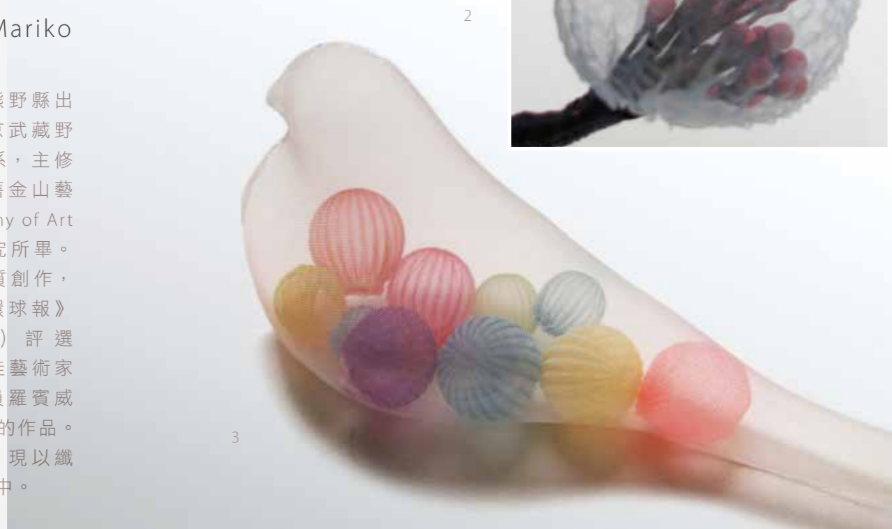
1-2 プローチ / 聚酯纖維 / 2014

藝術家，日本熊野縣出身。畢業於東京武藏野美術大學油畫系，主修油畫及版畫。舊金山藝術大學（Academy of Art University）研究所畢。早期以金屬材質創作，並被《波士頓環球報》（Boston Globe）評選為當年年最佳藝術家之一。已故演員羅賓威廉斯亦曾收藏她的作品。近年轉換材質，現以纖維藝術為主活動中。