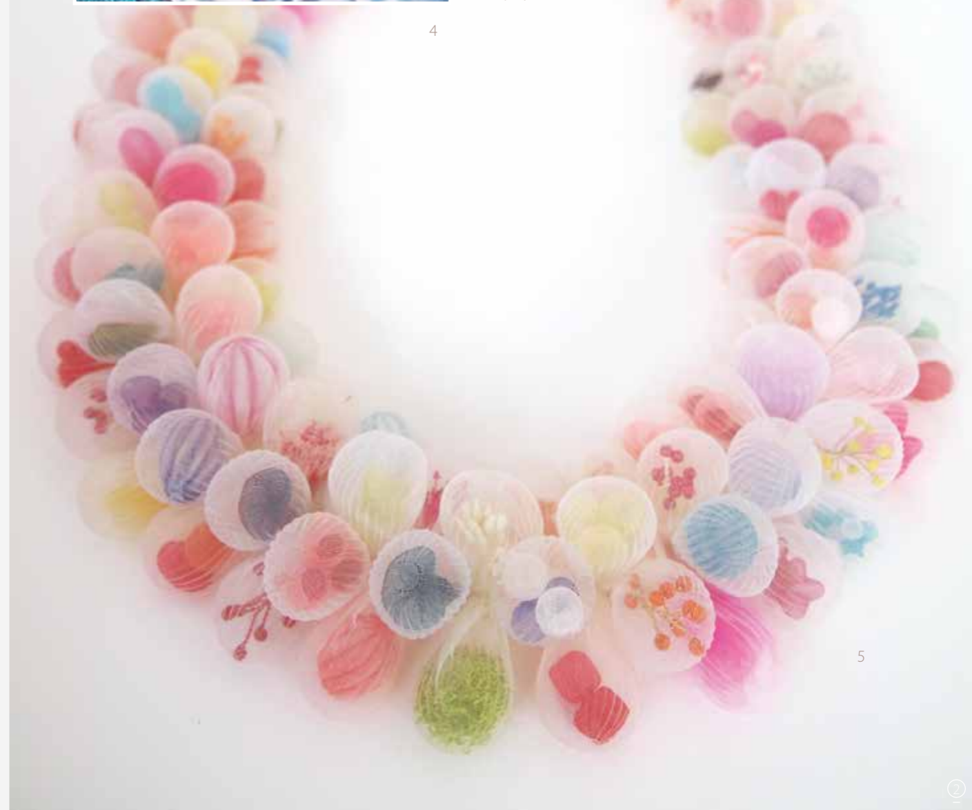
4 無題 / 聚酯纖維 / 2015

「我用金屬創作快 18 年了。要說是什麼讓我開始選擇其他媒材創作，就是對自己的既定風格感到厭倦了吧！」Kusumoto 從學生時代因學習蝕刻版畫而開始醉心金屬創作。每個作品均有引人驚奇的機關，從構思、電腦設計稿、紙製樣本、到拼接不同金屬等皆需龐大而縝密的準備才能完成。「以 18 年為分野，我想嘗試不能具體說出那是什麼的抽象概念，和完全異於金屬的材質創作。」而她所選擇的，是與堅硬金屬完全相反的聚酯纖維布。